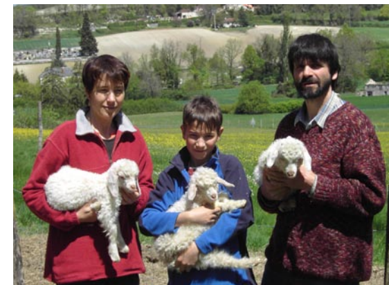
LA FAMILLE RUAMPS, ELEVEURS DE CHEVRES ANGORA