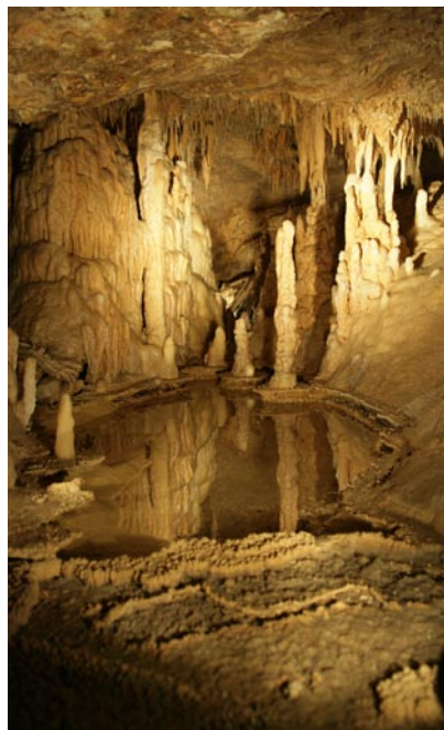
GROTTE DE ROLAND

Villages et petit patrimoine (fontaines, églises, moulin à vent.), visite du village de Montcuq (accompagnée ou en liberté), visite des chapelles romanes du Quercy Blanc, grotte de Roland.